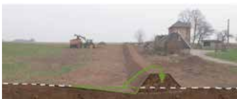
1 Exemple de décapage en pied de talus.

↑ Exemples de volumes de terre nécessaires en fonction des dimensions du talus, pour des pentes de 55°.