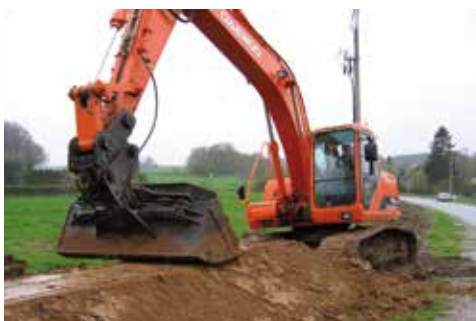
↑ Nivellement des flancs et du sommet.