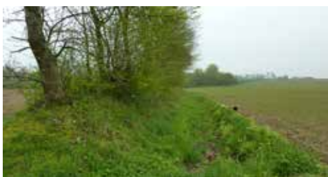
2 Exemple de talus avec fossé.