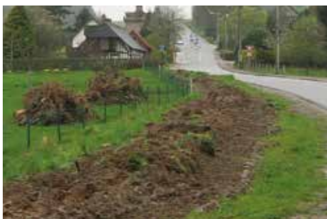
↑ Préparation de l'emprise du talus.